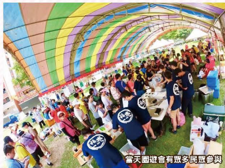
當天園遊會有眾多民眾參與