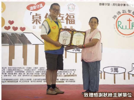
致贈感謝狀給主辦單位