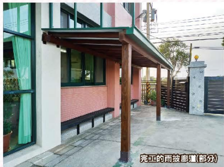
完工的雨披廊道(部分)

此次園遊會主要是要幫助路得更換餐桌桌椅及搭建雨披廊道，因為有社會大眾的支持，才能順利募得經費。目前雨披廊道已經完工，以後下雨時，老師、學生不用再擔心會滑倒、淋雨感冒，在雨披下還有設置木製的椅子，可讓學員在此處休息乘涼。感謝支此次募款園遊會的所有的同仁、家長、志工，以及眾多的善心人士的捐助支持，讓我們能夠更加完善路得的設施設備，讓學員有更良好的環境生活。